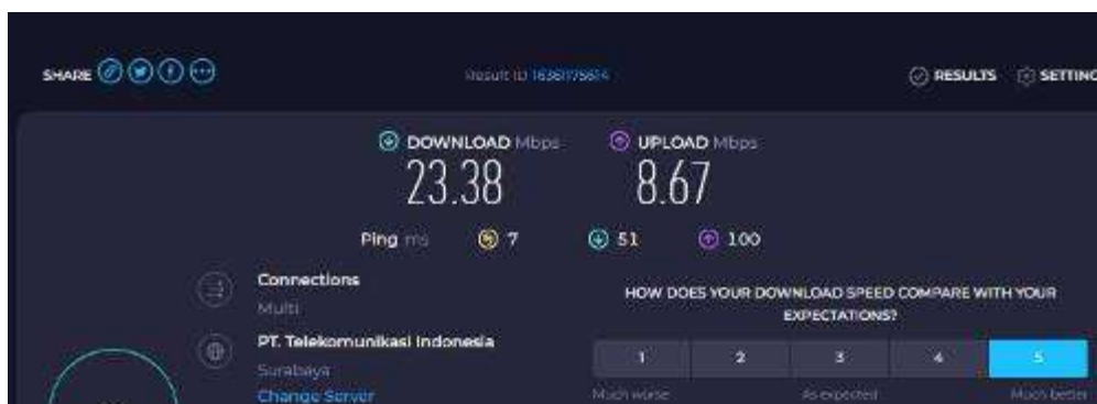
Gambar 7. Ping Latency setelah Dilakukan Kegiatan Pengabdian