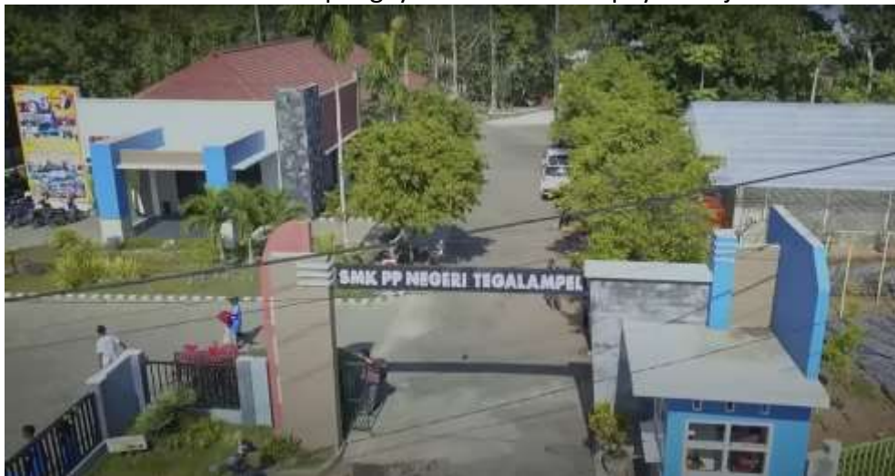
Gambar 1. Foto Udara SMK PP Negeri 1 Tegalampel

Pada dunia pendidikan, konektivitas internet merupakan komponen penting dalam upaya peningkatan layanan kualitas pendidikan. Seluruh entitas sekolah seperti guru, siswa dan tenaga administrasi memanfaatkan internet dalam keseharian di sekolah. Pendidik pada sekolah membutuhkan koneksi internet untuk membantu mendukung proses belajar mengajar di sekolah. Misalnya materi pembelajaran yang saat ini dapat dengan mudah diakses secara online. alat bantu pembuatan presentasi materi pembelajaran juga diakses secara online, dan perkembangan penggunaan elearning yang pesat terjadi karena adanya perkembangan konektivitas internet [2]. Selain itu, ujian yang diselenggarakan sekolah seperti ujian akhir semester dan ujian akhir tahun juga dilaksanakan menggunakan metode CBT atau Computer Based Test yang membutuhkan konektivitas internet yang handal. Tenaga administrasi juga memerlukan internet dalam rekapitulasi absensi, input data pada website, dan kegiatan lainnya. Siswa pada sekolah juga membutuhkan koneksi internet untuk pengayaan materi dan upaya belajar mandiri siswa.