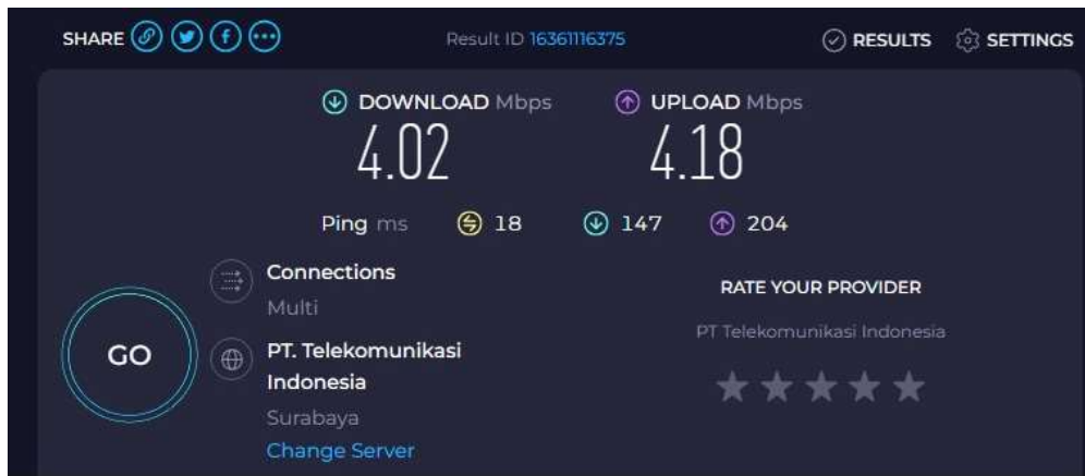
Gambar 7. Ping Latency sebelum Dilakukan Kegiatan Pengabdian

upload sebesar 204 ms. Sementara Gambar 8 menunjukkan koneksi setelah dilakukan kegiatan pengabdian dengan menambah 1 ISP, melakukan peremajaan dan menerapkan metode PBR, latency ketika jaringan idle adalah 7 ms, latency download sebesar 51 ms dan latency upload sebesar 100 ms. Hal ini menunjukkan bahwa terjadi peningkatan kualitas layanan internet di SMK PP N 1 Tegalampel.