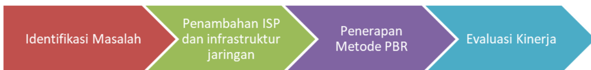
Gambar 3. Metode Pelaksanaan Pengabdian