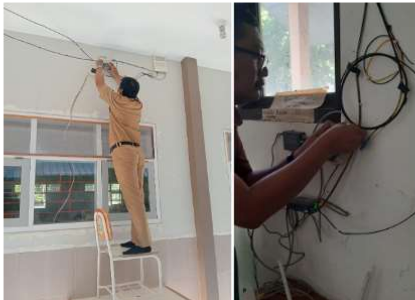
Gambar 4. Peremajaan Infrastruktur Jaringan dan Implementasi ISP 2 di SMK PP N 1 Tegalampel