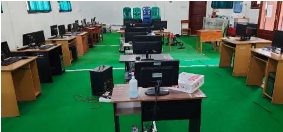
Gambar 2. Laboratorium Komputer SMK PP N 1 Tegalampel

jika banyak civitas yang menggunakan jaringan tersebut. Hal ini berkebalikan dengan kondisi ideal yang dibutuhkan yaitu untuk mendukung KBM yang optimal, diperlukan juga koneksi internet yang handal dan cepat [3].